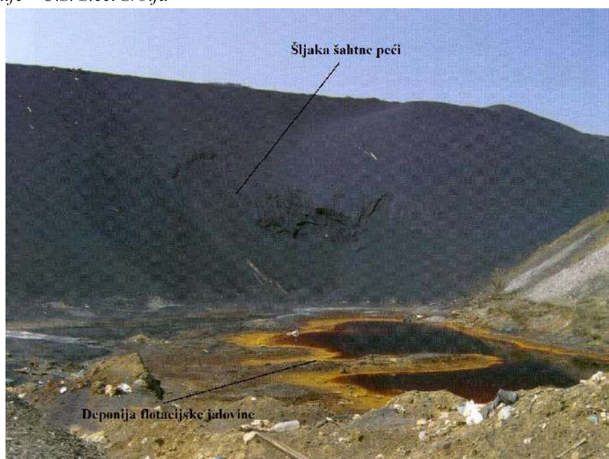
Slika 2 - Izgled deponije šljake šahtnih peći Topionice olova "Trepča".