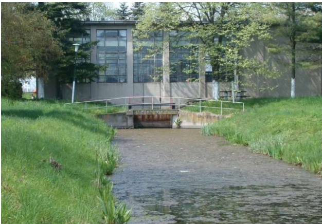
Slika 1.- Crpna stanica »Donje polje« Figure 1 – Pumping station 'Donje Polje'

Crpna stanica Donje polje jedina je crpna stanica u sistemu Galovica koja se koristi za navodnjavanje (lokacija ove crpne stanice je iskorišćena kao osmatrački punkt za praćenje kvaliteta vode Galovice).