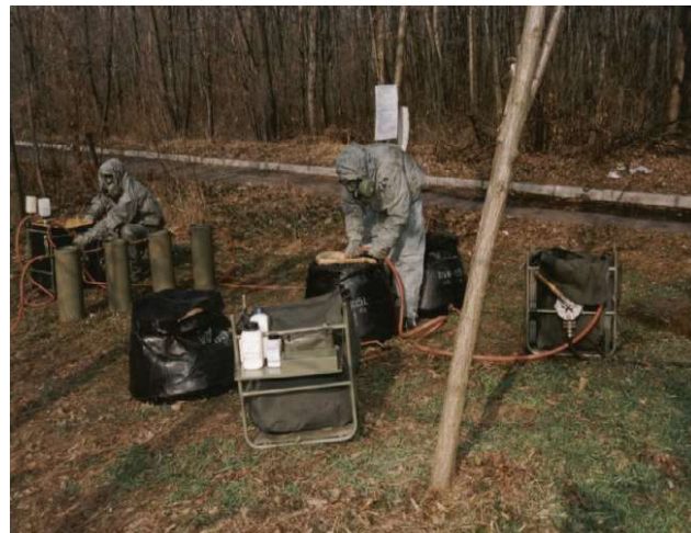
Slika 3. - Rad na običnom i kompleksnom prečišćavanju vode Figure 3 – Simple and complex water treatment