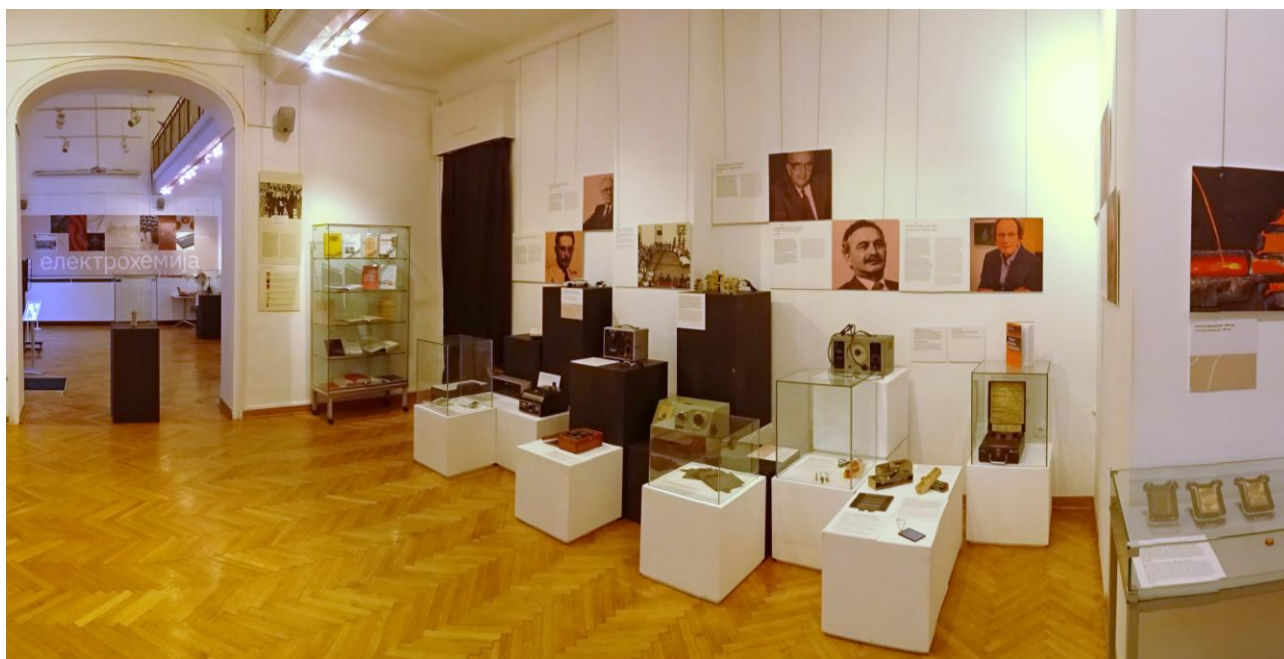
Deo izložbe o Beogradskoj školi elektrohemije

Sa željom da se elektrohemija u Srbiji predstavi kako učesnicima konferencije, tako i široj javnosti u našoj zemlji, 1. septembra 2020. planirano je otvaranje izložbe pod nazivom: Upoznaj elektrohemiju kroz Beogradsku školu elektrohemije , autora Aleksandra Dekanskog. Uprkos činjenici da je Sastanak pretvoren u onlajn skup, otvaranje izložbe je održano kako je i planirano, drugog dana Belgrade Online skupa, u Galeriji nauke i tehnike SANU u Beogradu. Izložbu je zvanično i virtuelno otvorio dobitnik Nobelove nagrade za hemiju prof. M. Stenli Vitingem, putem video linka.