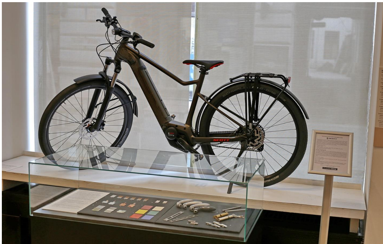
Električni bicikl i predmeti sa različitim prevlakama Electric bike and coated items

Elektrohemijsko taloženje predstavljale su brojne metalne prevlake, dekorativne i zaštitne, bakarni prah i modeli elektroda iz procesa rafinacije bakra [4,5]. Korozija i zaštita od korozije [5] je prikazana predmetima sa metalnim i organskim prevlakama, kao što su građevinski okov, kvake i cilindri brava. Ulogu elektrohemije u sintezi medicinskih biomaterijala ilustrovala su proteza kuka i hidrogel obloge za rane sa elektrohemijski sintetisanim nanočesticama srebra [6].