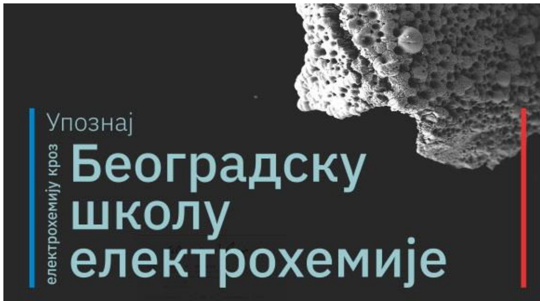
Detalj sa korica kataloga izložbe